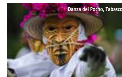
Danza del Pocho, Tabasco.

Tabasco, pródiga tierra donde habitaron las grandes culturas: Olmeca, Zoque, Azteca y la maravillosa cultura Maya. Un destino de Naturaleza con Cultura, muchos lugares por descubrir, mágicos rincones para disfrutar