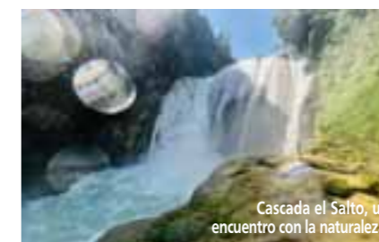
Cascada el Salto, un encuentro con la naturaleza.

Para los amantes asiduos a las aventuras y desconectarse de la realidad citadina, en Chiapas existe un lugar que, sin duda, dejará una experiencia grata marcada de por vida, se trata de un lugar enclavado en la