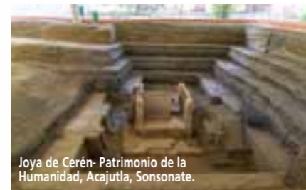
Joya de Cerén- Patrimonio de la Humanidad, Acajutla, Sonsonate.

El Parque Arqueológico Joya de Cerén es un ícono de la cultura prehispánica que muestra cómo fue la vida cotidiana de los mayas. Fue declarado Patrimonio de la Humanidad en 1993, y es llamado La Pompeya de América, en