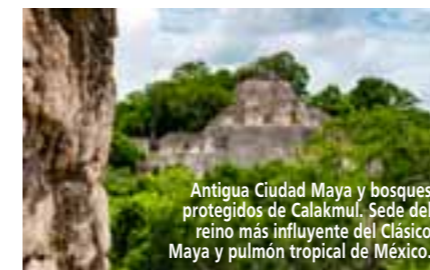
Antigua Ciudad Maya y bosques protegidos de Calakmul. Sede del reino más influyente del Clásico Maya y pulmón tropical de México.

Sobresaliendo por encima de la extensa selva del Petén Campechano, las enormes estructuras de la antigua sede del clásico tardío del Reino Kaan no dejan duda del esplendor e importancia de esta influyente urbe. Se observa una planeación urbana única que data desde el preclásico medio, con grandes plazas ceremoniales y conjuntos residenciales que, según estudios recientes, se extendería más allá de 90 km2. Su gran influencia política, comercial y militar se inscribió en sus más de 120 estelas, el mayor número encontrado en cualquier otro sitio maya número, además de las referencias hechas por un gran número de ciudades que le fueron contemporáneas, refrendando la historia política y dinástica de esta urbe.