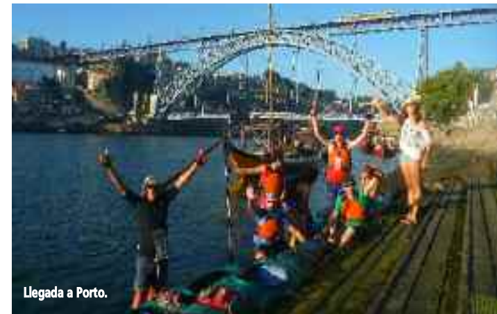
Llegada a Porto.

Incluye todo el material necesario para navegar (Kayak de mar doble o individual, palas, chalecos, cubrebañeras, bolsa y bote estanco); Guías, técnicos en salvamento acuático y primeros auxilios; Seguros R.C. y accidentes; Apoyo por tie-