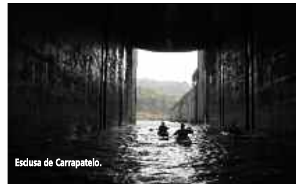
Esclusa de Carrapatelo.

La ruta del Douro, clasificada de Interés Turístico Internacional, nos acerca a poblaciones portuguesas que viven de cara al río, como vía de comunicación y recurso. El río Duero/Douro es uno de los ríos más importantes de la Península Ibérica. Nace en Fuentes del Duero, provincia de Soria, en los Picos de Urbión y desemboca en el océano Atlántico en el estuario de Porto, siendo el río de mayor caudal absoluto de la geografía peninsular. El Douro, ahora, es en realidad una sucesión de tranquilos y estirados lagos que organizan cinco grandes presas y cinco esclusas que existen en el tramo portugués colocadas estratégicamente en los extremos de cada una de ellas.