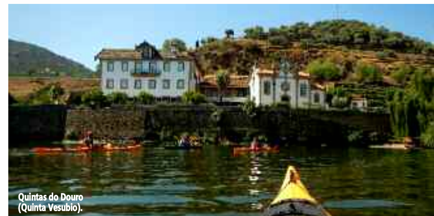
Quintas do Douro (Quinta Vesubio).