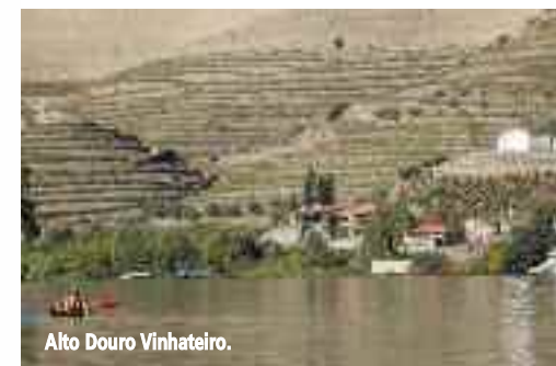
Alto Douro Vinhateiro.