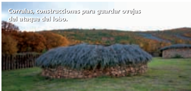
Corralas, construcciones para guardar ovejas del ataque del lobo.