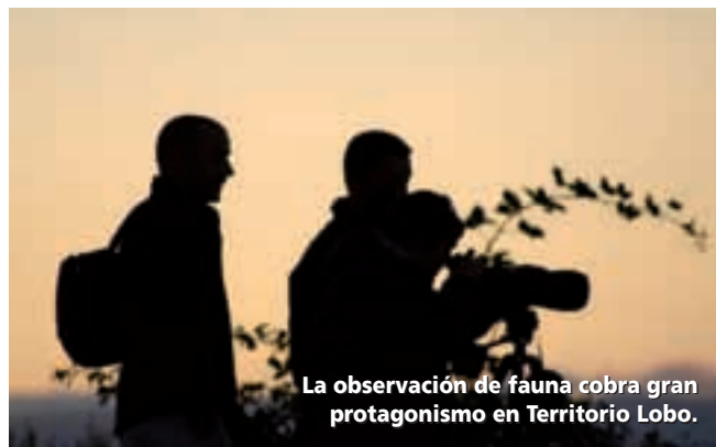
La observación de fauna cobra gran protagonismo en Territorio Lobo.

destinos de ecoturismo y contribuir al desarrollo económico de amplias áreas rurales de la provincia.