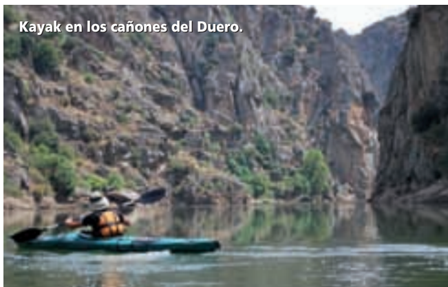
Kayak en los cañones del Duero.