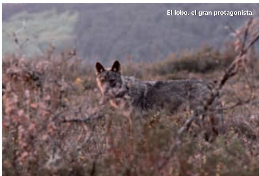
El lobo, el gran protagonista.

De nuevo se darán cita las empresas nacionales e internacionales más relevantes del sector del turismo de naturaleza, con exposiciones, seminarios, talleres, música, teatro... Todo un evento de ecoturismo y naturaleza en España, para amantes de la naturaleza. En esta ocasión, el área de actuación de Territorio Lobo se extiende hacia otros espacios naturales de Zamora, como son el Lago de Sanabria, los Arribes del Duero y las Lagunas de Villafáfila, donde la organización ha programado diferentes experiencias a lo largo del año, ampliando así su efecto promocional para dinamizar todos los