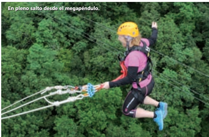
En pleno salto desde el megapéndulo.

nas pequeñas: el parque está diseñado también para que los más pequeños (a partir de 3 años) tengan sus propias vivencias de aventura en plena naturaleza, así dispone de tirolinas de 50 a 80 metros de largo y a 20 metros de altura, cruzan-