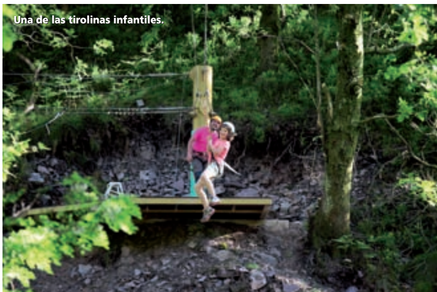
Una de las tirolinas infantiles.