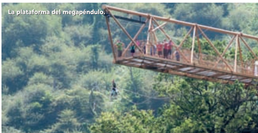
La plataforma del megapéndulo.