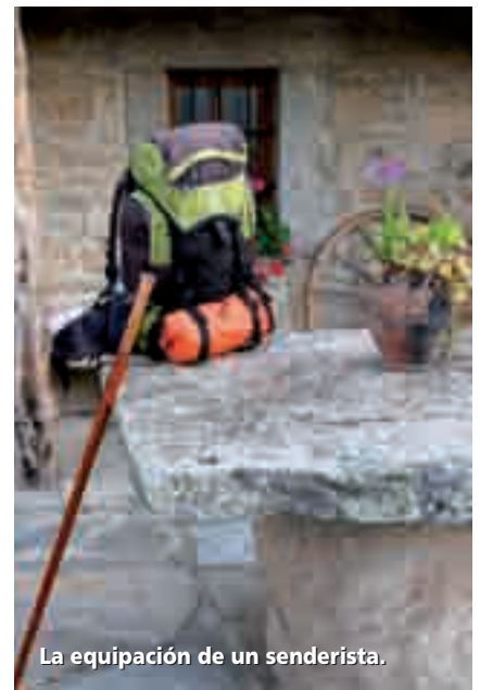
La equipación de un senderista.