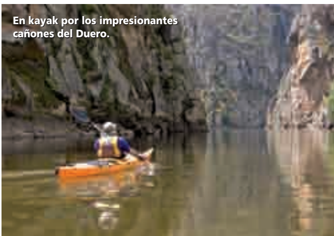
En kayak por los impresionantes cañones del Duero.