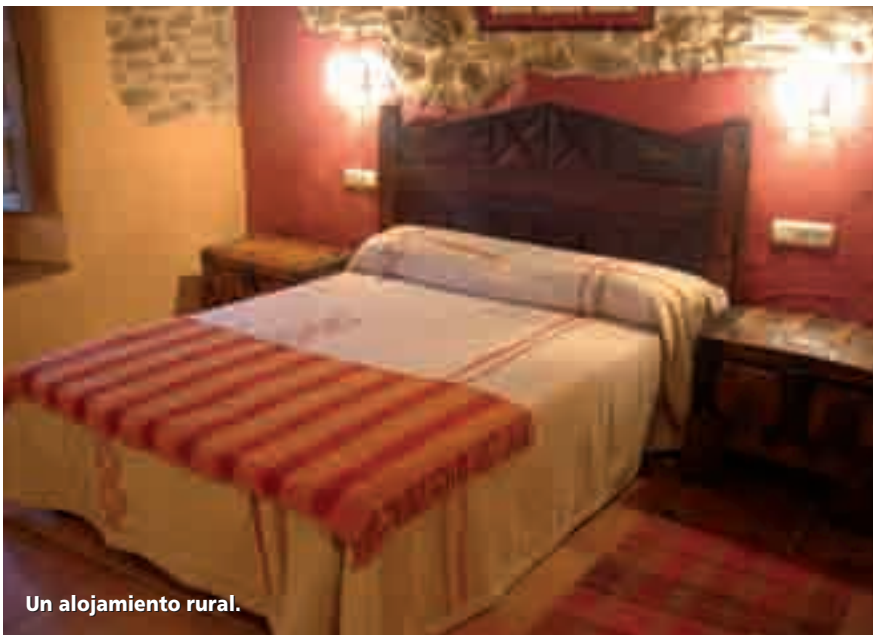
Un alojamiento rural.