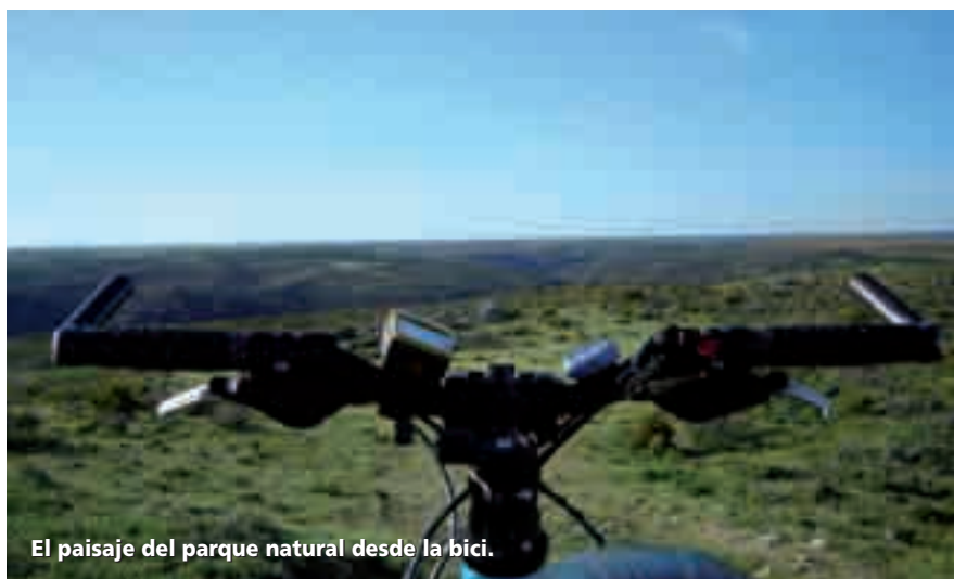
El paisaje del parque natural desde la bici.

Frontera Natural se puede recorrer de norte a sur, a pie o pedaleando desde la