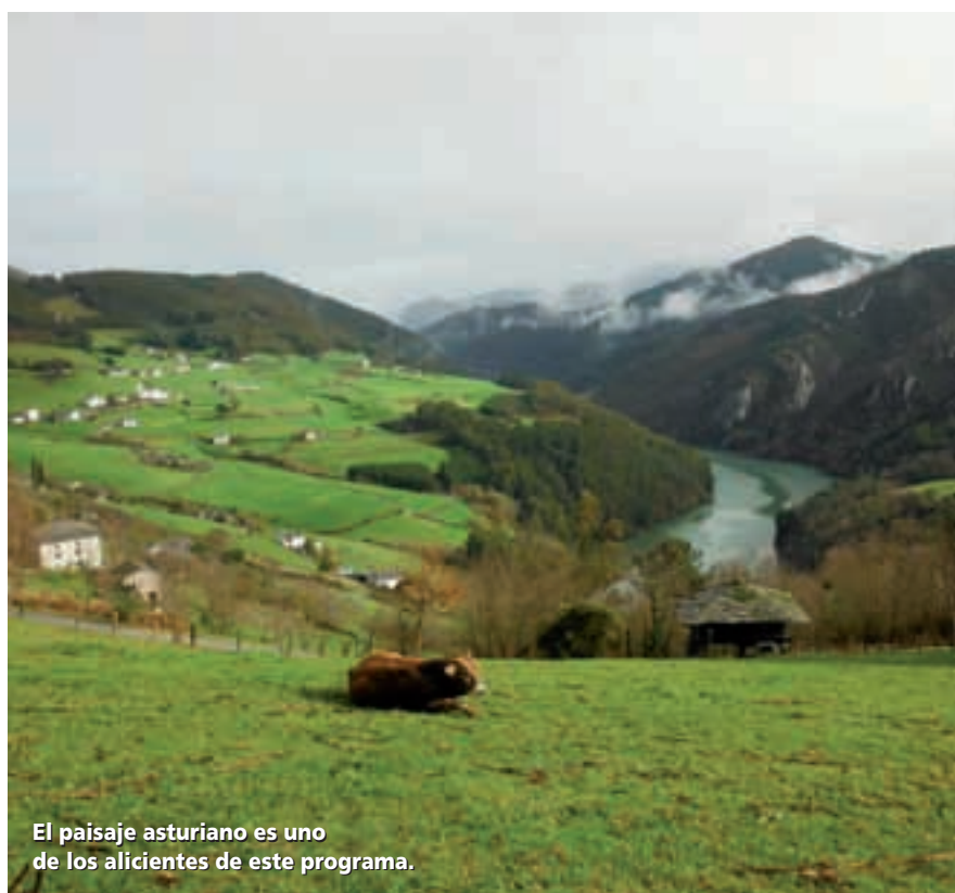
El paisaje asturiano es uno de los alicientes de este programa.

Sección del Turismo Activo Active Tourism Section