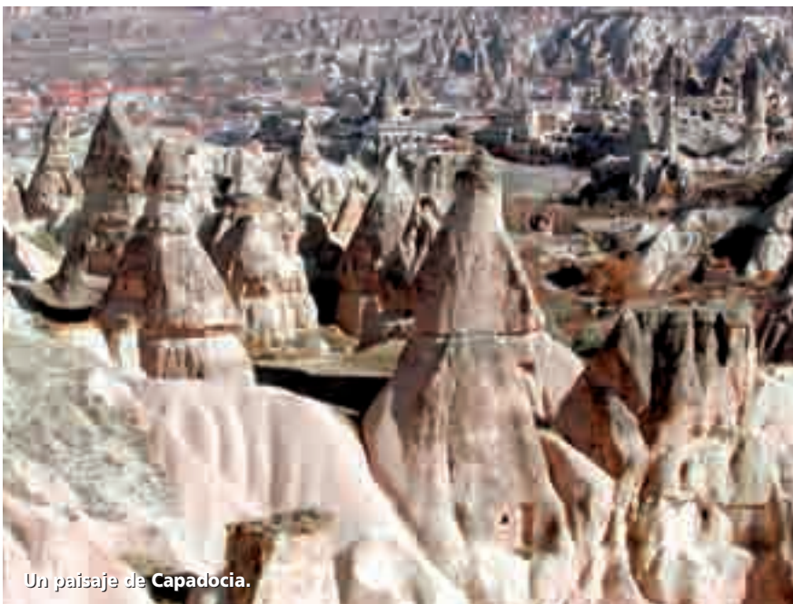
Un paisaje de Capadocia.

las ciudades subterráneas, donde disponían de almacenes de provisiones, fuentes de agua, producción de vino y templos para protegerse de las persecuciones e invasiones.