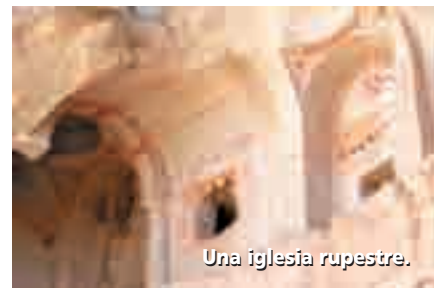
Una iglesia rupestre.

prehistórica y muchas civilizaciones dejaron su huella, empezando de los hattis y seguidos por los hititas, los frigios, los persas, los romanos, los bizantinos, los selyúcidas y los otomanos. Capadocia, por su situación geográfica, era una región extremadamente estratégica. Por lo tanto llevaba las influencias históricas y culturales de las rutas de comercio importantes, como la Ruta de Seda. Diferentes filosofías y religiones se cruzaron en esta región. En el siglo II, los cristianos vinieron a instalarse en Derinkuyu pasando por Antakya (Antioquia) y Kayseri. Los primeros cristianos se refugiaron en