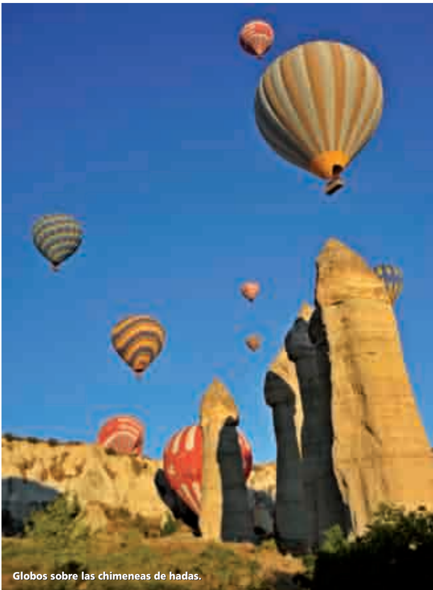
Globos sobre las chimeneas de hadas.