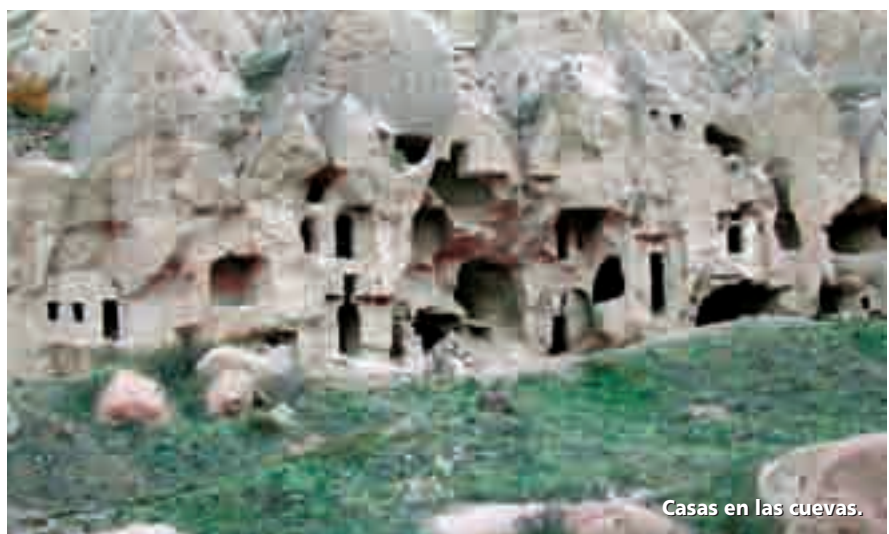
Casas en las cuevas.