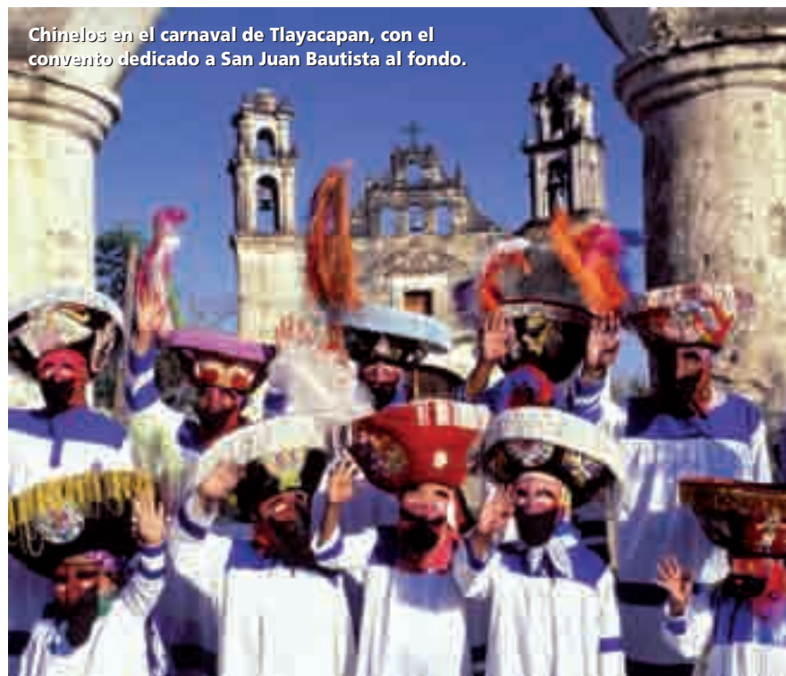
Chinelos en el carnaval de Tlayacapan, con el convento dedicado a San Juan Bautista al fondo.