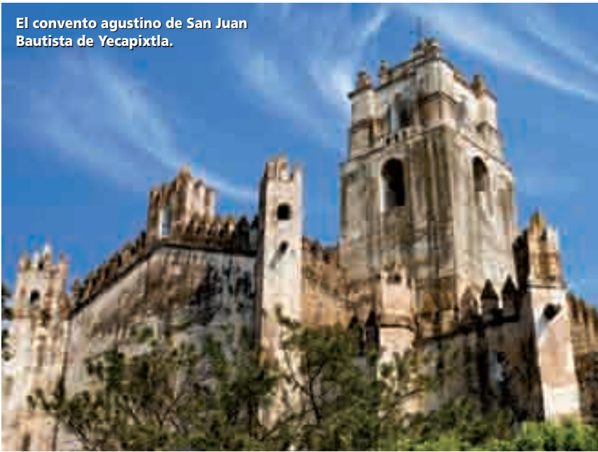
El convento agustino de San Juan Bautista de Yecapixtla.