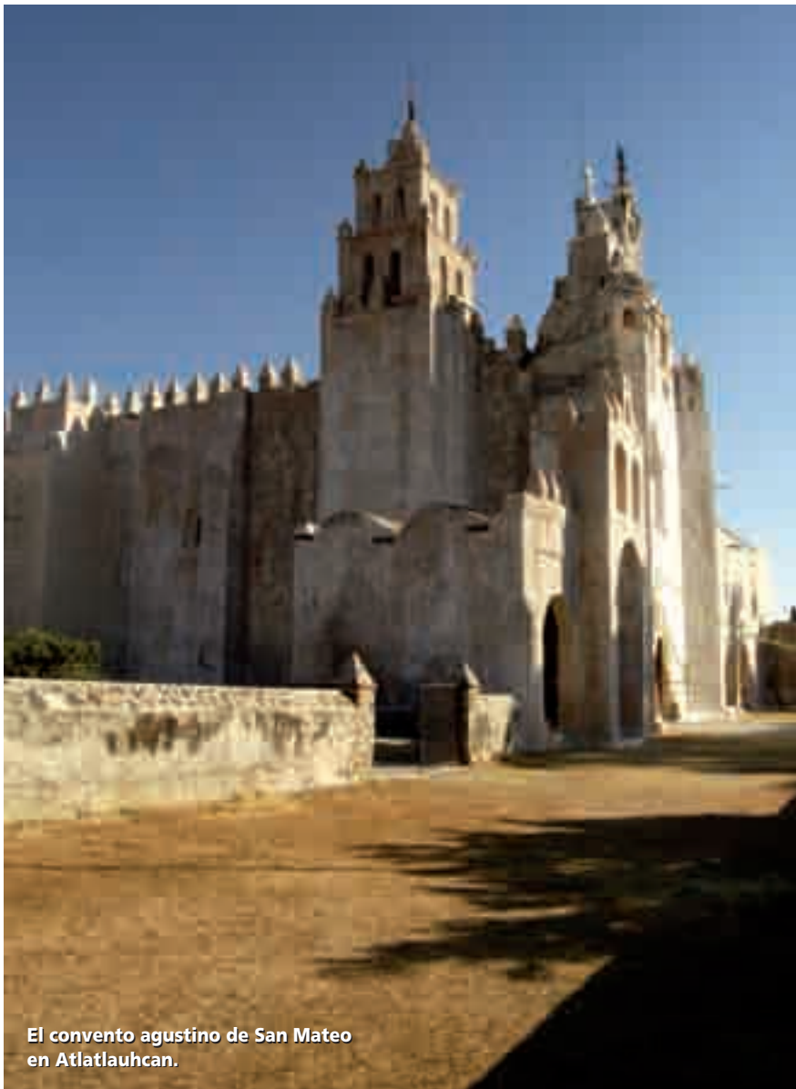
El convento agustino de San Mateo en Atlatlahucan.

PARA MÁS INFORMACIÓN: www.morelostravel.com.mx