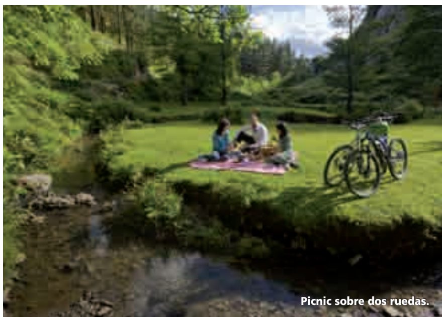
Picnic sobre dos ruedas.