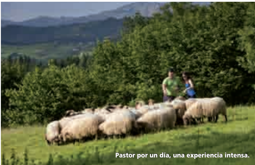
Pastor por un día, una experiencia intensa.