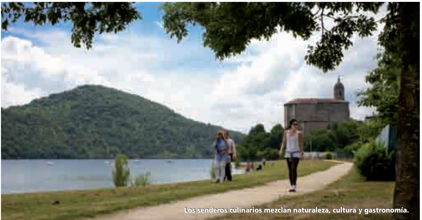
Los senderos culinarios mezclan naturaleza, cultura y gastronomía.