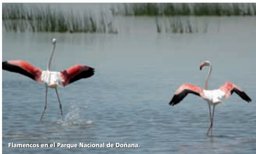
Flamencos en el Parque Nacional de Doñana.

ofrece la posibilidad de contemplar las mayores colonias de aves acuáticas de toda Andalucía y algunas de los más importantes de Europa. Un espacio que permite también observar un buen número de aves rapaces, entre las cuales destaca el águila imperial.